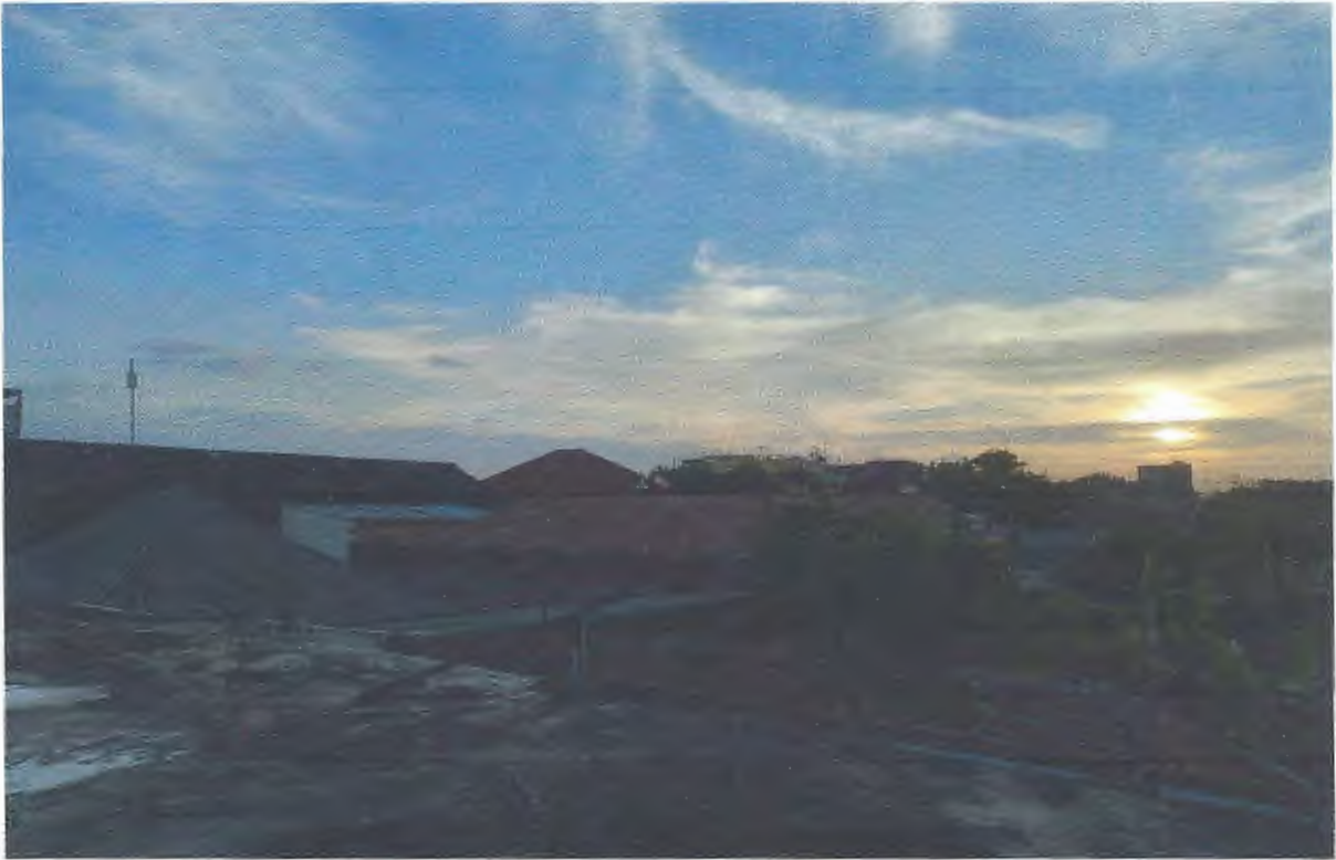
Foto Atap Gedung